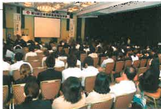
講演、セッション共に全国から集まった医療・福祉・介護関係者であふれました