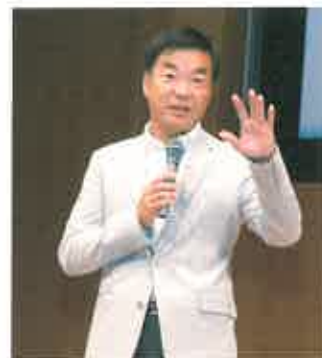
元神奈川知事・松沢成文氏