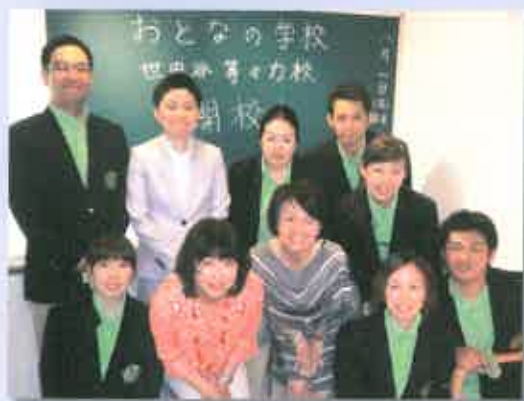
開講式で決意も新たに

8 月1日、新東京百景の1つ、等々力溪谷の近くに東京事業部4校目の【おとなの学校】世田谷等々力校が開校しました。