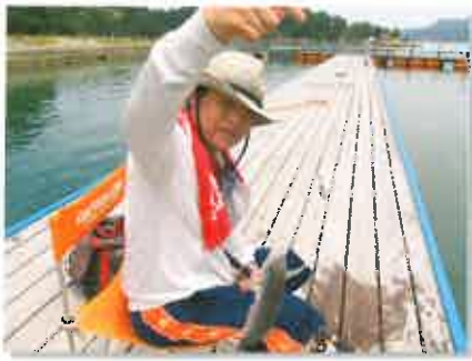
上々の釣果にご満悦のお客様