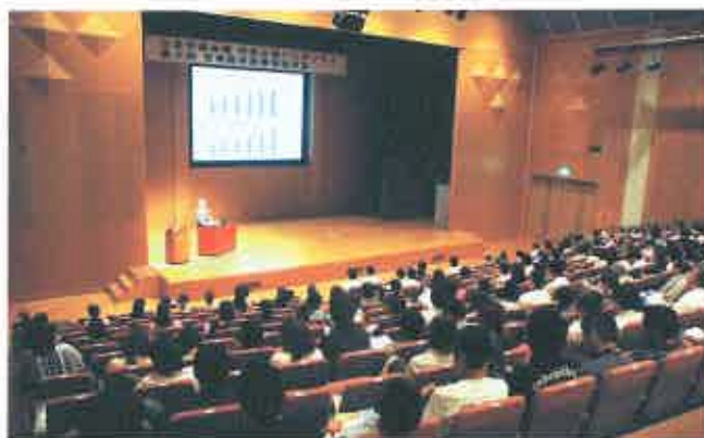
約300名の方々が聴講されました