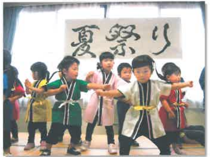
振りが見事決まって、かっこいい！

8 月6日、ピュア・サポートグループ夏祭り「お祭りコンテスト」が【おとなの学校】本校で開かれ、【ここへおいでよ】の園児11名が「お江戸はカーニバル」の踊りで出場。当日は【おおうらさんち】のお客様と共演し、地域の皆様や本校生徒さんから大きな拍手！出番前は「ドキドキする」「いやだ、いやだ」と泣きそうなお子もいましたが、音楽が鳴り出すと元気いっぱい。ほら、こんなに上手にできましたよ。