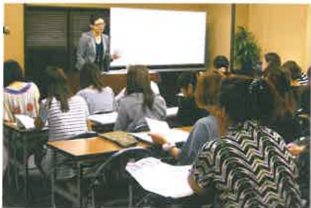
第1回目は調剤事務の基礎知識

平 成23年度の新講座「調剤薬局事務資格取得講座」(8月16日～9月15日・全10回)がスタート。24名の受講生が専門講師から毎回2時間の授業を受け、9月末に実施される試験に臨みます。この講座は「仕事に就きたい！」と願うお母さん方の希望に応えるもの。反響が大きく、募集後すぐに定員に達しました。講座開催中、子ども達は保育士が託児ルームで預かります。講師は「約1ヶ月で調剤薬局事務の専門知識を習得するため、家庭での予習・復習も必要。子育てや家事との両立は大変でしょうが、体調に気をつけて頑張りましょう！」と励ましていました。