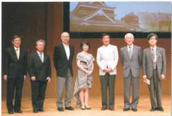
日本学術会議「市民公開シンポジウム」講師並びに役員の皆様