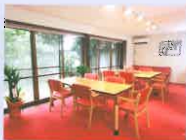
庭の見える明るく広々とした食堂

都心とは思えないほど水と緑に恵まれた住宅街の、アットホームな戸建型デイサービスです。開校3日間の内覧会にも多数のご見