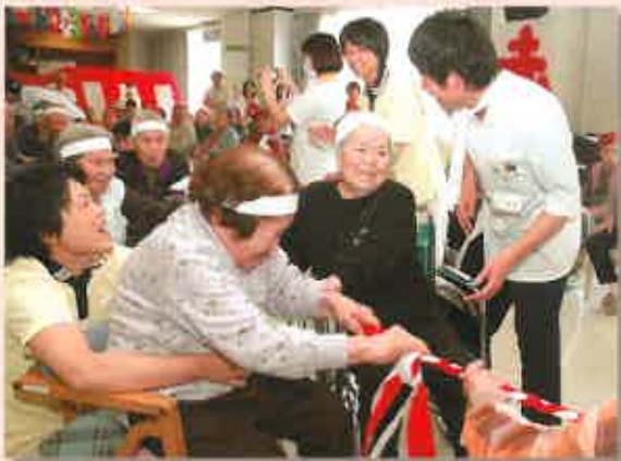
力と力がぶつかり合う綱引きに会場も大興奮！

5月14日に、【おとなの学校】本校・三郎校、【おおうらさんち】、【はっぴいはうす】 合同の「おとなの学校大運動会」を開催。紅白に分かれた“選手”達は、パン食い 競争や玉入れなどの競技に果敢に挑戦！ 全力で頑張った生徒さん達に、ご家 族やスタッフから大きな拍手が送られました。