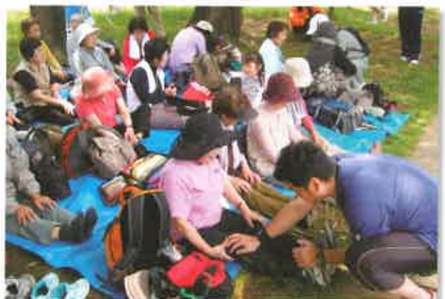
終了後は、入念に整理運動