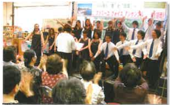
表現豊かな20名の合唱に参加者も大拍手!

6 月12日午後、【熊本市 母子福祉センター】で開催した「ふれあいコンサート」に、受講生や近隣の方など30名が参加されました。岩尾先生の指揮によるファミリー ヴォイス アンサンブルの歌声は、美しく透明で伸びやか。選曲も唱歌やディズニーメドレー、オペラの独唱まで幅広く、ご参加の皆様も一緒に口ずさんだり、手拍子を打ったり。当日は大雨でしたが、心が温かくなるコンサートになりました。