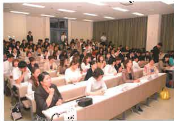
質問も多く、会場は熱気に包まれました

他施設の長所を取り入れ、顧客満足度や業務改善につながることは、グループ理念「地域を支える善い型を創る」ための努力。これらの取り組みを通じて、グループ・スタッフは個々の“地力アップ”につなげています。