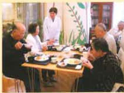
夕食は地域の方々への試食会でも好評

パティシエ特製のクッキーやスイーツも限定販売。「手頃な値段で美味しい」と好評です。また、ケーキセットも販売予定です。ぜひご賞味ください。お問い合わせはフリーコールでお気軽に。