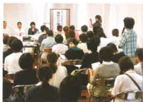
活発だった質疑応答