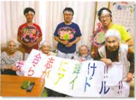
心を込めて作った横断幕