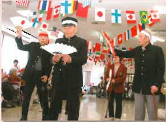
本校・応援部が威勢のいい、三三七拍子を披露