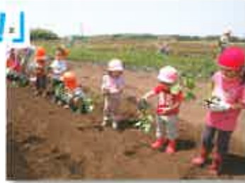
みんなで枝豆の苗を植えました

5 月19日、【ここへおいでよ】の園児9名が、菊陽町にある当グループの農園「ピュアファーム」へ。園児たちは、昨年からは月1回程度、農園で野菜の苗植えや収穫体験を行っています。普段、土に触れる機会が少ないので最初は恐る恐るでしたが、最近では楽しそうに土いじり。また、収穫した野菜は家に持ち帰ります。食べ物への感謝の気持ちを育み、野菜嫌いの解消にも役立つ農作業体験はこれからも続きます。