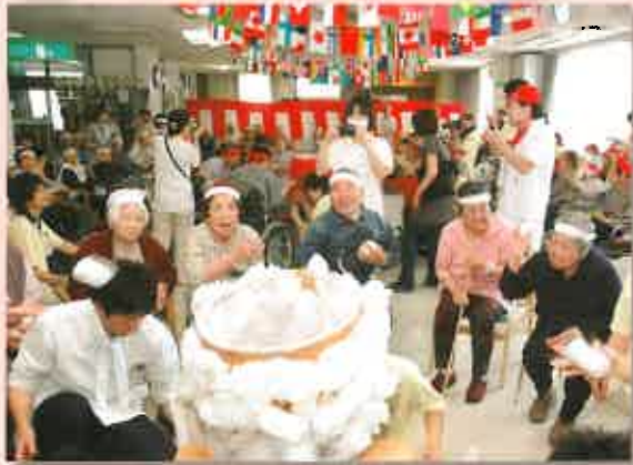
玉入れでは紅白譲らぬ熱戦が展開