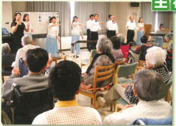
コーラスグループ「ナイチンゲールズ」の合唱

5 月15日の午後、出田眼科病院のコーラスグループ「ナイチンゲールズ」の皆様が「おとなの学校」本校を訪問。混声合唱によるメドレーなど7曲を披露されました。フルートやピアノ伴奏に加え、手話を交えた美しい歌声に、「有り難くて言葉もありません」と感無量の生徒さんも。また、多くの生徒さんが手拍子を取りながら聴き入っていました。