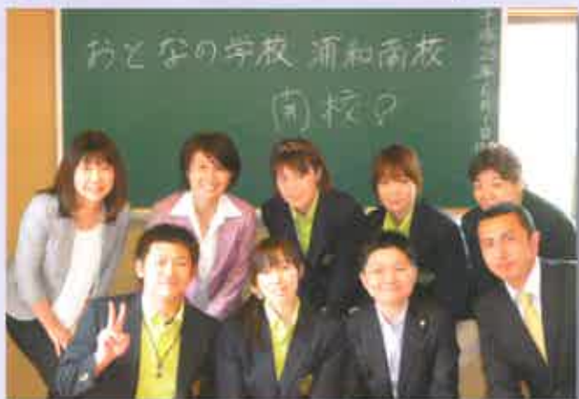
新たにPSGIに仲間入りした浦和南校のスタッフと