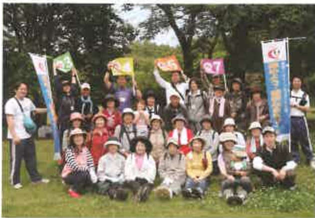
34名の参加者が立田山の自然を満喫

ス ファイン】の立山健康運動指導士が作成したコースに沿って、植物や生き物の観察などを行いながら約1時間の散策。2～84歳までの幅広い年齢の皆様が、心地よい汗を流されました。