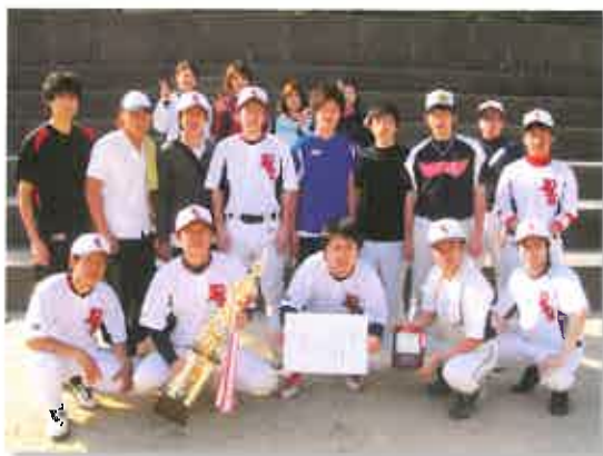
優勝旗を手に感無量！

老健施設で働く人々の親睦と健康づくりを兼ねた「第23回 老健対抗ソフトボール大会」が5月15日、富合町雁回公園グラウンドで開催され、25チームが参加しました。当グループからは2チームが出場。日ごろ培ったチームワークを発揮。炎天下での接戦を制し、悲願の初優勝を手にしました。この喜びを糧にグループパワーで、さらに一致団結。熊本から「おとなの学校」の元気を日本全国に発信していきます。