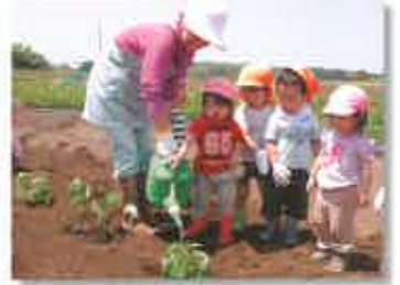
水やりもお手伝い!