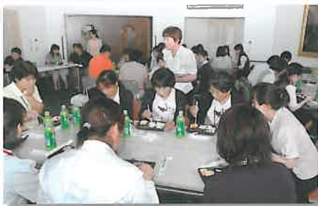
延命庵・武徳殿と八角堂での「さくら弁当」試食風景

7月20日(延命庵・武徳殿)・21日(八角堂)の両日、【ピュア・サポートグループ】の在宅系施設責任者の企画・主催による「ピュア・サポートアカデミー」を開催しましたので、その様子をご紹介します。なお、同アカデミーは秋にも開催予定です。