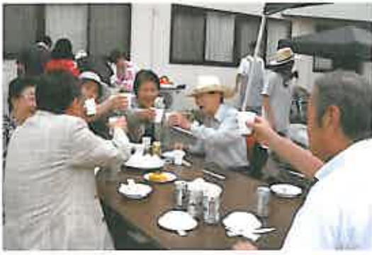
肉や野菜が焼ける前から「乾杯!」の皆様