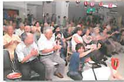
会場の声援に園児たちも張り切って演奏！