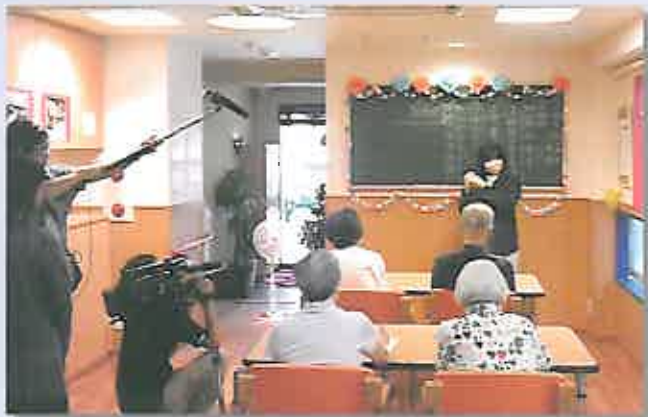
社会科の授業を取材中のTBS番組スタッフ

住所 東京都港区南青山4-10-4 モン・パピールビル1F TEL.03-6447-0733/FAX.03-6447-0734 E-mail:og-minamiaoyama@ourakai.com