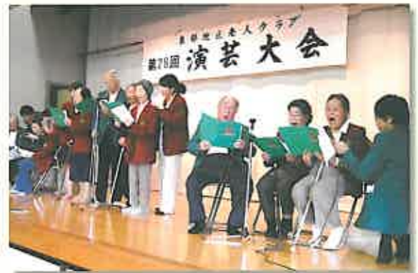
部員一丸となって成果を披露した合唱部の皆さん

歌 うことを生き甲斐にしている【おとなの学校】合唱部の生徒さん。7月10日には、東部市民センターで開かれた「東部地区老人クラブ」の第28回演芸大会に出場し、練習の成果を披露しました。朝から自主的に発声練習をしたメンバー10名は、スタッフや学友10名のサポーターと共に舞台へ。「われは海の子」「おとなの学校・校歌」を熱唱し、「緊張したけど気持ちよかった」と満足気でした。