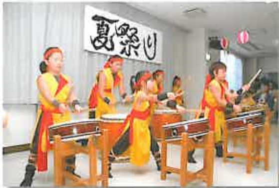
ぎんなん保育園の太鼓演奏で開幕