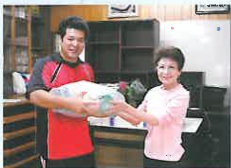
ボランティアの方から古屋健康運動指導士へ贈呈

6月25日、尾ノ上校区4町内にお住まいのボランティアアグリグループから、当グループに雑巾の贈呈がありました。戴いた雑巾は「おとなの学校」本校や「メデイカルフィットネスファイブ」などで活用しています。同グループからは毎年、善意の雑巾贈呈があり、スタッフ一同大変感謝しています。