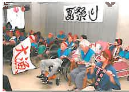
練習を重ねた本校の「大漁！ソーラン祭り」