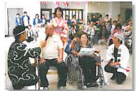
1位は【おとなの学校】通所リハビリ&三郎校！