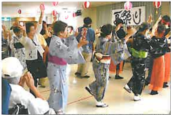
おてもやん総踊りは帯山婦人会や地域の方も一緒に