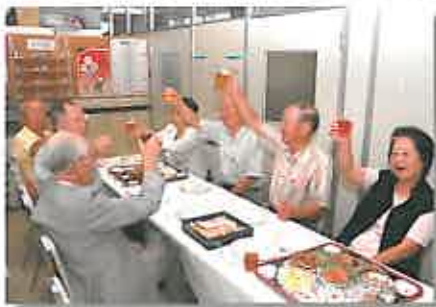
地域の皆様も多数参加