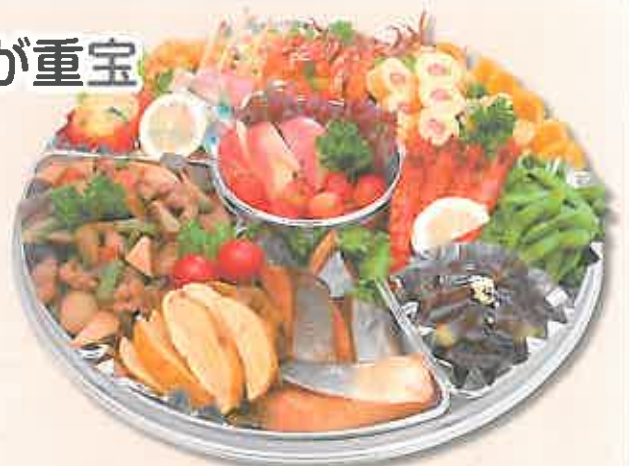
写真は43cm×43cm(規格)の5,000円オードブル(例)

添加物の多い加工品を使わず、調味料を含むすべての食材の安心・安全にこだわった手作りのオードブル。一度利用すると、「次もぜひ！」とリピーターになる方も多数。また、行楽弁当・敬老会のお祝い弁当も予約受付中です。ぜひご利用ください。9月15日までに新規契約をされたお客様に、「2日間(昼食・夕食)無料キャンペーン」を実施中！