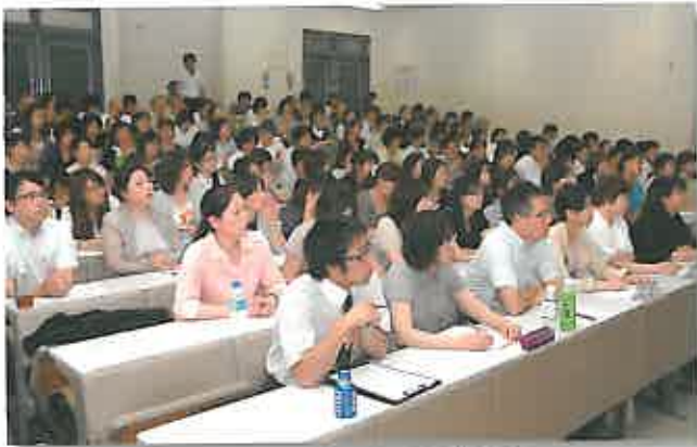
各事業所の発表に聞き入る職員達