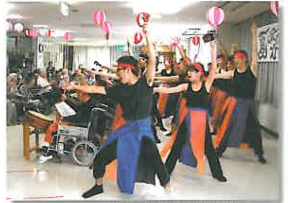
本校太鼓部&スタッフの「よさこい」は迫力満点

8月7日、当グループ「夏祭り」を【メディカルケアセンター ファイン】&【おとなの学校】を会場に開催。お客様・ご家族・地域の皆様が、お祭りコンテスト・出店・ボランティアステージ等への参加や応援を楽しまれました。幼児から高齢者まで一堂に集う「夏祭り」は、大切な世代交流の場となっています。