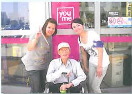
無事お買い物を終えて、スタッフとニコリ!