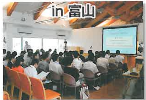
富山で開かれた第3回合同研修会