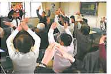
運動は転倒予防や肩こり・腰痛予防などを指導しています