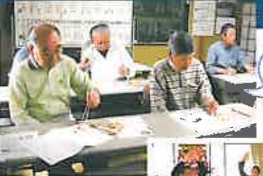
「いきいきサロン」で片マヒの疑似体験を指導

リハビリテーション部と【メディカルフィットネス ファイン】が連携し、地域の「いきいきサロン」や「ふれあいサロン」をサポート。平成21年度は15校区で計55回、リハビリ講話のほか、認知症予防や体力維持に役立つ運動指導などを実施。高齢者の安心に寄与しています。