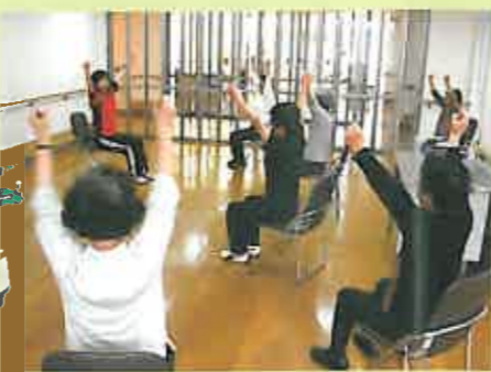
月曜日の「健康教室」風景

毎週月・火・水・金曜日、「健康教室」を開催。運動不足の解消や生活習慣病の改善に最適です。 フィットネス会員様は無料。会員外の方は1回400円です。開催時間はお問い合わせください。