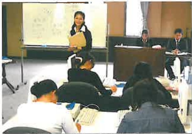
希望多数のため来年度も開催予定(託児有り)

当 センターでは6月5日～26日まで毎週土曜日(計4回)、母子家庭や寡婦の方の就労支援として「テレコミュニケーター養成認定講座」を開催。13名の受講生が言葉使い・発声・応接・パソコン操作・実技訓練などを習得されました。指導にあたる日本トータルテレマーケティング株式会社は「講座終了後に認定証を授与し、1ヶ月間は就職支援も実施。子育て中の方に配慮した勤務シフト等もあります」と話しています。