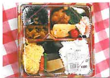
手作り弁当も人気