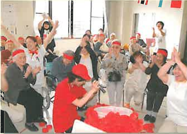
玉入れに勝利して喜ぶ赤組の皆さん