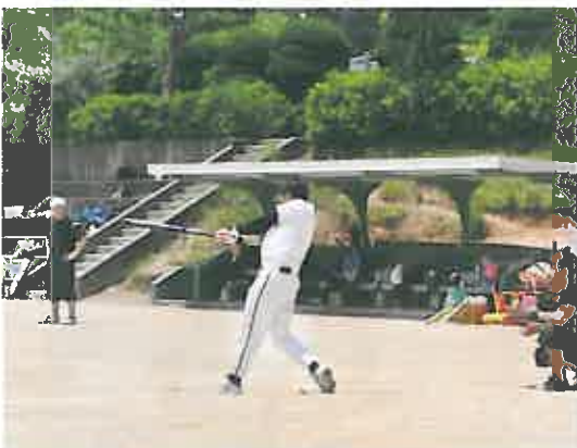
当グループが事務局機能を担いました