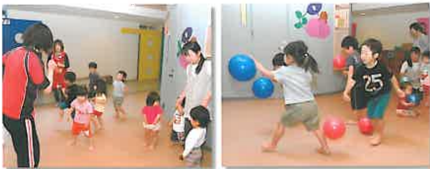
ボール遊びやリズム体操で体を動かす楽しさを学ぶ園児達

こ こへおいでよ]では、毎週1回「体操教室」を実施しています。最近の子ども達は、思いっきり体を動かしたり、屋外で遊ぶ機会が減った影響で体力が低下する傾向にあります。それを改善するために、【メディカルフィットネス ファイン】のスタッフ指導のもと、ボール遊び、リズム体操、鉄棒やマットを使ったサーキットトレーニングなどのメニューを実践(約30分)。園児達は、走る・跳ぶ・踊るなど全身を使う遊びを通して、楽しみながら体力や柔軟性を高めています。