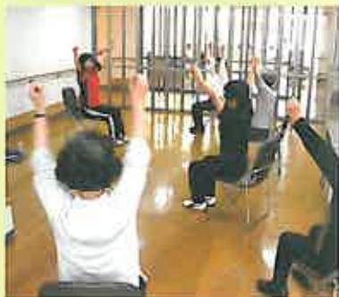
月曜日の「健康教室」風景