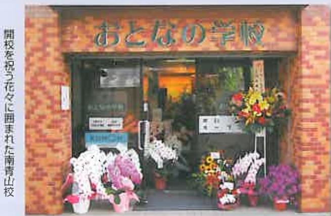
開校を祝う花々に囲まれた南青山校