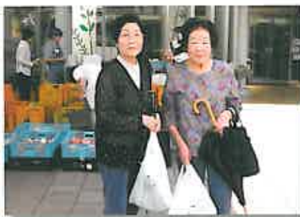
近隣の方も「助かります」