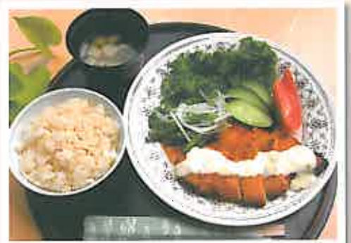
火曜日 チキン南蛮(500円)