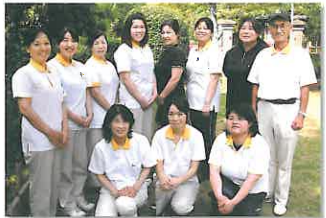
私達介護スタッフがお世話します!

【おおうらさんち】 【はっぴいはうす参番館】 【はっぴいはうす】 【はっぴいはうす六番館】