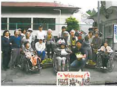
来ところ思ご田を園日記録撮影