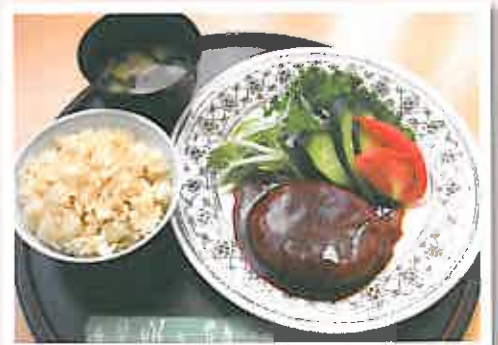
金曜日 ハンバーグ(500円)