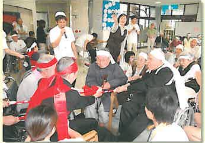
綱引きは一步も譲らぬ大熱戦に!