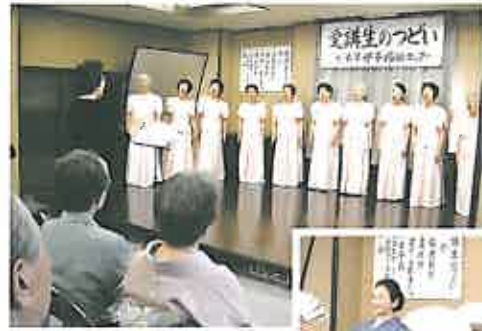
自主サークル「舞踊」& 「コーラス」の受講生も練習成果を披露

3 月15日開催の「熊本市 母子福祉センター」の受講生のつどい。各講座も日ごろの練習の成果がよく現れ、「毎年、上達が著しい！」と、ご来賓や地域の皆様から盛大な拍手がおくられました。また、多数の見学者から「立派だった」「感激した」などのアンケートも寄せられました。