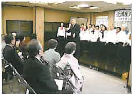
3月15日「受講生のつどい」の童謡講座の皆さん

母子家庭や寡婦の方々の就業支援や福祉向上のための事業を行う「熊本市母子福祉センター」。その指定管理者として、「社会福祉法人照敬会」(NPO法人)「こへおいでよ」共同企業体が、平成21～23年度まで引き続き、管理運営に当たることが決定しました。平成18～20年度の指定管理を務めるなかで、講座数と受講生が増加。さらに、資格取得者数のアップに加え、父子家庭向けの講座や子育て支援事業への意欲的な取り組みが評価されたものです。当グループも、共同企業体を全面的にバックアップします。