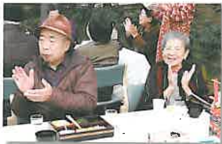
出し物に、参加者からは大きな拍手が