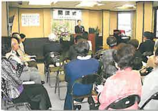
熊本市子育て支援課・高瀬課長も来賓のご挨拶

4 月4日、ご来賓の方々や講師の皆様、そして受講生の出席のもと、【熊本市 母子福祉センター】平成21年度の開講式を行いました。