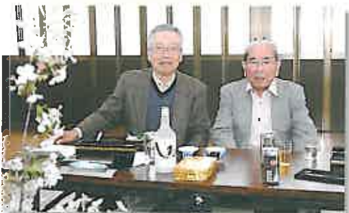
尾ノ上校区7町内の武内自治会長(左)と、さくら会の徳永会長も元気にご参加