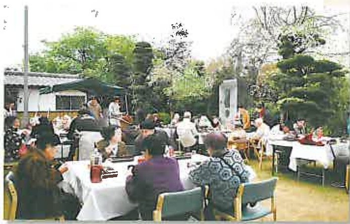
「カリリ庵」のお弁当に舌鼓を打ちながら桜や余興を満喫

この日は、武徳殿で尾ノ上校区7町内の皆様も花見を開催。カラオケなどで楽しいひと時を過ごされました。