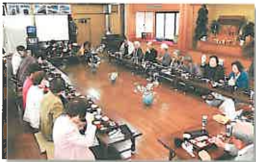
武徳殿内に桜の枝を活けて、気分は満開!