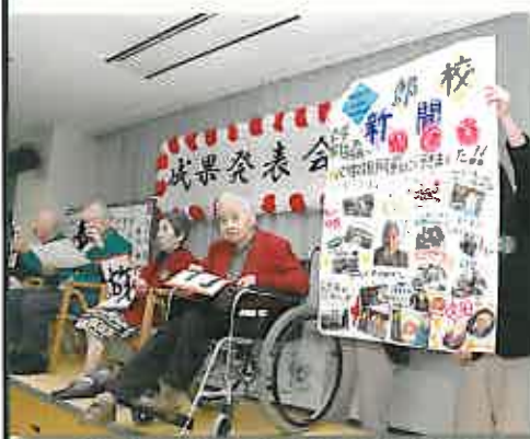
楽しかった旅の思い出を写真と共に紹介