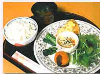
地元産の食材による無添加の自然野菜ランチ(例)

【メディカルケアセンター ファイン】1階の「カフェ・ソーレ」では月～金曜日のランチタイムに「自然野菜ランチ」(600円)をお出ししています。材料は熊本県産にこだわった自然栽培の米・野菜を使用し、醤油・味噌・塩・酢・みりんなどの調味料も無添加。安全・安心でヘルシーなグルメランチをご夫婦やお友達とご一緒にいかがですか。ただし、毎日10～20食限定なので、お昼は早めのご来店か、フリーダイヤルによる前日予約がお勧め。ほかに【カロリー庵】特製のお弁当もあります。併せてご利用ください。