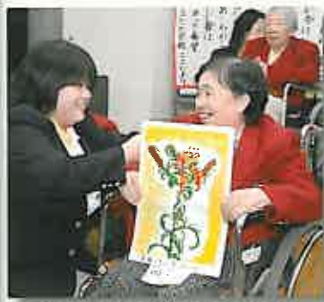
絵の出来ばえを述べる生徒さん

11月16日、「おとなの学校」の成果発表会を行い、本校&三郎校の生徒さんが日頃の成果を披露しました。本校の皆さんは合唱のほか、書道、貼り絵などの制作物を発表。また、三郎校は10月に行った阿蘇への修学旅行の思い出を、学級新聞にまとめました。今回は、ピュア・サポートグループの文化祭の日に行ったので、ご家族や近隣の方々も多数ご見学。いつも以上に熱気にあふれる発表会となりました。