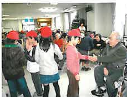
交流タイムのあと、握手でお別れ

12月2日と3日、尾ノ上小学校3年生が「総合的な学習」の一環で「おとなの学校」本校を訪問。車イス体験を行ったほか、本校生徒さんと交流しました。児童達は手作りのビンゴゲームや福笑いなどを持参。テーブルごとに世代を超えたふれあいが進み、あちこちで楽しげな笑い声が。最後は「今日はありがとう」「また遊びにおいで」と別れを惜しむ言葉が飛び交いました。