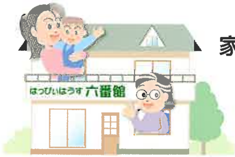
イラストはイメージです。