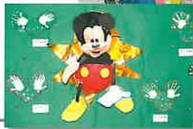
みんなでミッキーの大きな貼り絵を作ったよ!