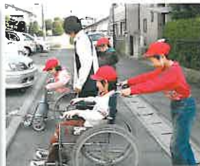
川上PTの指導で車イス操作を練習