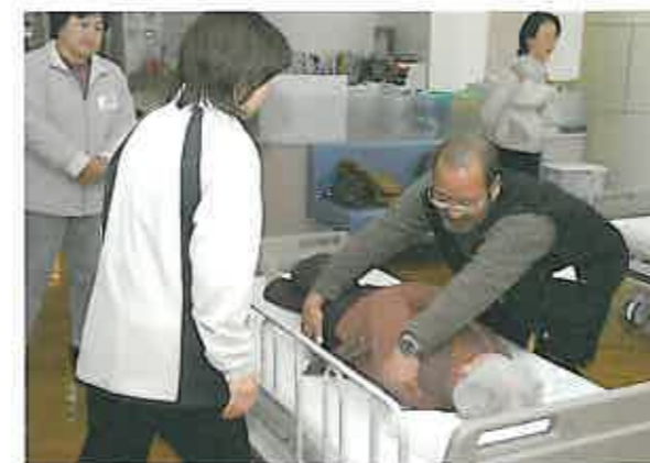
スタッフのアドバイスを受けながらの介助実技

2月16日、平成19年度・第3回「みんなの会」が開催され、「ピュア・サポートグループ」のリハビリスタッフから介護技術について学びました。約15名の参加者は、スライドを見ながら介助のポイントや注意点を習得。その後、3班に分かれてベッドからの起き上がりや車椅子への乗り移りなど、状況を想定しての実技を体験。参加者からは「自宅での介護に役立てたい」と、好評でした。