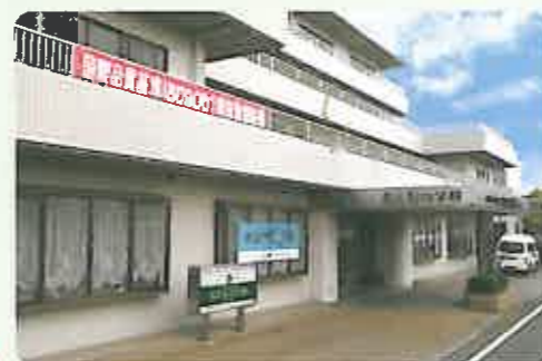
シニアリハウス・システムの中心となる【おとなの学校】本校

介護が必要と認定された方(入所・通所)に各種サービスを提供。「くもん学習療法」を導入し、学校生活になぞらえたリハビリや生き甲斐づくりなど独創性に富む介護施設です。