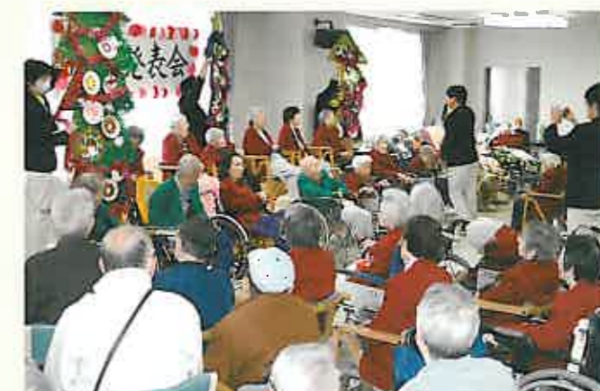
皆で作ったツリーを披露する生徒さん