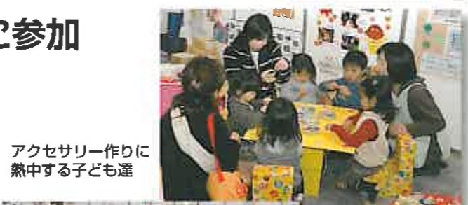
アクセサリー作りに熱中する子ども達

2月23・24日にグランメッセで開かれた「子育て応援団すこやか2008」(主催:子育て応援団実行委員会)に、【ここへおいでよ】【熊本市夢もやい館】【熊本市母子福祉センター】も参加。パネル展示のほか、知育にもとづく手作りおもちゃ&ゲームコーナーなどを設け、大勢の親子連れに喜ばれました。また、当グループは県内の子育て支援団体・グループの連絡・調整など、子育てネットワークブスの事務局機能も担い、相互の情報交換や連携強化に努めました。