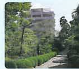
多くの樹木と花に囲まれた閑静な【ゆいの家】