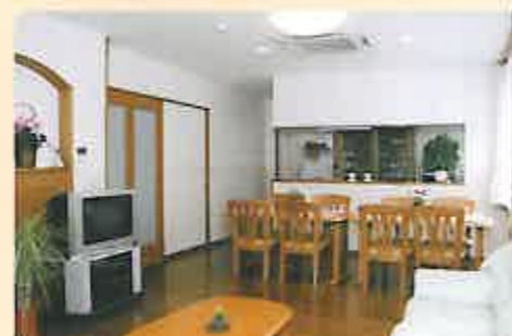
家庭的な雰囲気であらげる【はっぴいほす】