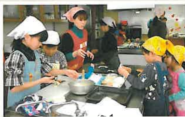
健全児童育成・ふれあい事業の一例 「親子お楽しみ会」への参加

【熊】 本市母子福祉センターでは平成19年度「受講生のつどい」を3月16日(日)12時30分~開催。受講生の作品展示やお点前などを、地域(一般)の皆様もぜひお楽しみください。また、平成20年度は4月5日(土)13時30分からの「開講式」で活動をスタート。就職支援や仲間づくりに役立つ講座への受講をお待ちしています。