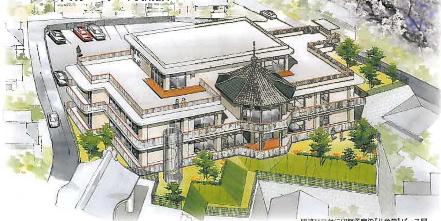
閑静な高台に建築予定の【八角堂】パース図

【ピュア・サポートグループ】の社会福祉法人 照敬会が熊本市に申請した特別養護老人ホーム【八角堂】が採択され、西部エリア(本妙寺近く)で着工の運びとなりました。高齢者の福祉充実につながる新規事業を、グループ全体で支援いたします。