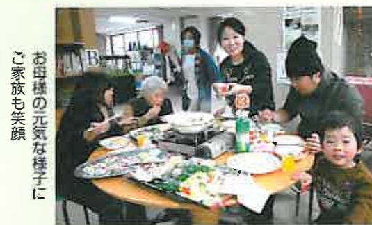
お母様の元氣な様子に ご家族も笑顔

1月26日、【おとなの学校】本校の成果発表会と成績表授与を行いました。生徒さんは園工では大きな飾り物、音楽では「知床旅情」の合唱など、それぞれの得意科目を披露。参加者の大きな拍手を受けました。その後、ご家族を交えた新年会に移り、鍋を囲んで団らん。「楽しかなあ」「ご飯が美味しか」と終始、嬉しそうでした。