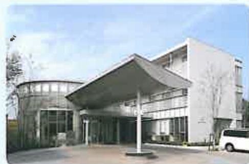
緩和ケア病棟を備えた【メディカルケアセンターファイン】

カフェテリアを思わせる待合室とホテルフロント並みの受付、心地よいカウンセリング・ルームなどが揃っています。リハビリテーションのほか、医・食の両面で「生きる力を支える」緩和ケア病棟もあります。