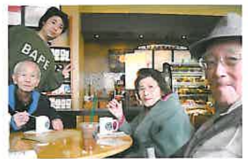
「若者には負けられん」と、コーヒータイムを満喫!

お客様やご家族に、寒い時季の楽しい企画として提案したのは「イルミネーションを見に行こう」と「スターバックスへ行こう」の2つ。どちらも参加者が多く、好評でした。特にスターバックスでは、おしゃれな店内でお気に入りのコーヒー&ケーキを前に笑顔、笑顔の皆様。「こんなに美味しいコーヒーは久しぶり」と寛いでおられました。