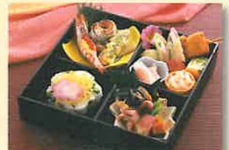
お花見弁当は予算や人数に応じてご用意します(写真は1,000円相当)

「おおうらさんちのおべんとう」は愛情込めたお母さんの味、健康志向の家庭料理。だから、化学調味料は一切使いません。調理スタッフの朝一番の仕事は花カツオなどから天然だし(1日に10回前後)をとること。うま味たっぷりの天然だしで調理する野菜やヒジキ、大豆などの煮物は薄味でもコクがあり、素材独特の美味しさが楽しめます。もちろん、花見弁当も天然だし! 町内やグループのお花見に、ぜひご用意ください。