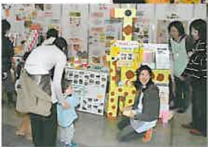
園児手作りの黄色いキリンが目玉!