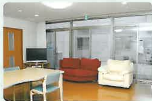
明るいリビングのほか、個室・リフト付特殊浴槽なども完備

人生の最後を「病院や施設ではなく在宅で」とお考えの方、身体に障害がある方や長期療養中の方などがご入居中です。全個室でフロントスタッフが24時間常駐。【ファイン】との連携で、医療依存度が高い方も病院にいるような安心が得られます。年齢や入居期間の制限もありません。