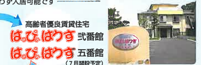
個室の自由さと、食事・入浴の安心が嬉しい【はっぴいほす 貳番館】

60歳以上で自炊が困難な方や、ひとり暮らしや住宅事情に不安がある方、車椅子の方などが対象となっています。プライバシーを尊重しながら食事などのサービスを提供。1回ごとに湯を入れ替える清潔な個室浴も好評です。外泊・外出も自由です。