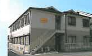
はっぴいほす 外観

食事などの基本サービスが付いた居住施設で、介護認定を受けた方へのヘルパー派遣などもお手伝いします。適度な広さは認知症の方に適した住宅といえます。